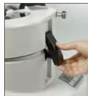
Автоматическое аварийное отключение при открывании