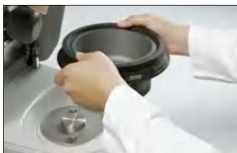
Просто в использовании и особенно надежно: быстроразъемное байонетное крепление ступки