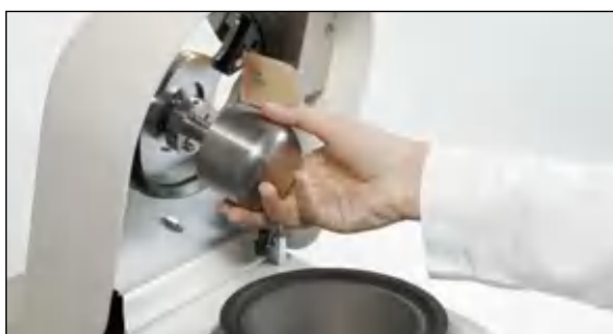
Практичная установка пестика без использования инструмента – для быстрой работы и простой очистки